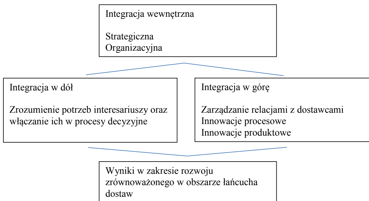
Rys. 2. Konceptyjny model integracji zrównoważonego łańcucha dostaw

Integracja dla potrzeb rozwoju zrównoważonego uzupełnia tradycyjną integrację łańcucha dostaw. Rozwój takich łańcuchów powiązany jest z lepszym zrozumieniem potrzeb szerokiej grupy interesariuszy oraz wdrażaniem praktyk w zakresie rozwoju zrównoważonego.